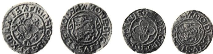
Skilling og Søsling fra Flensborg 1566