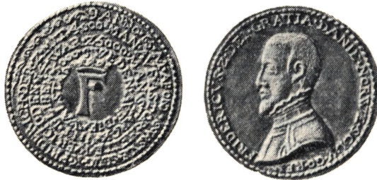
Medaille over Sejren ved Axtorna

Dog var det de danske Rytterfaner, som sejrede ved Axtorna den 20. Oktober 1565.