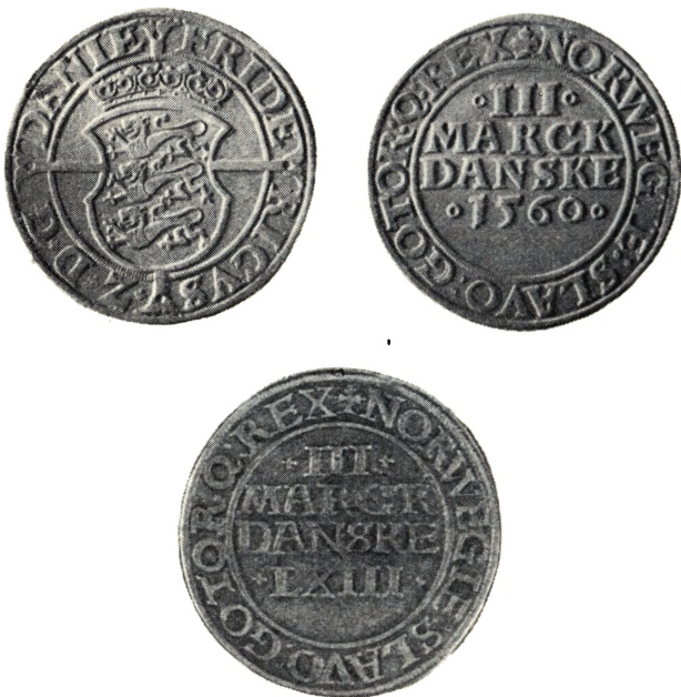
Daler (3 M danske) 1560 og 1563

Møntmesteren om Udmøntning af 20 000 Dlr. i 3 M Stkr. Der skulde ikke foretages anden Forandring ved Mønten end Kongenavnet. Den skulde slaas med det samme Korn som de andre 3 M Stkr. ere. 1)