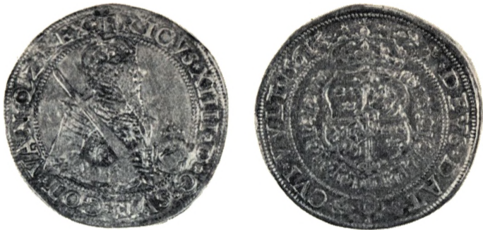
Erik XIV.s Daler 1561