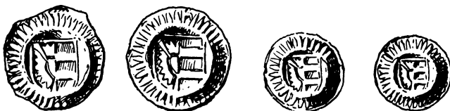
2 Blafferte og 2 Hulpenge uden Kors i Nældebladet

Denne Blaffert har derfor formentlig intet med Frederik I. at gøre, medmindre man da vil betragte Korset som Delmenhorst Vaaben, men dels passer Tegning og Stilling til Oldenburgs Vaaben næppe, dels er det da mærkeligt, at det ikke skulde bibeholdes paa de andre Blafferter. Mønten er udgaet for Johan Adolfs Regning, mens han