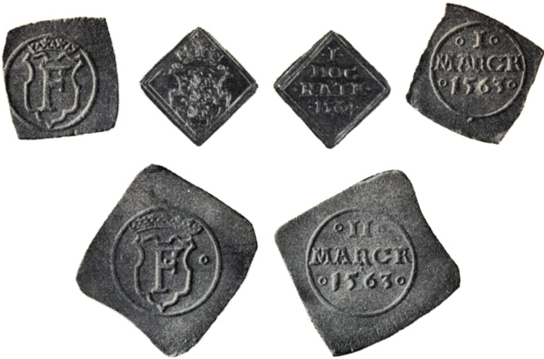
Dukat 1564 2 og 1 M Klippinge 1563

Klippingsmønten udmøntedes med forskellige Aarstal efter den Aargang, de udmøntedes, oprindeligt 1563 efter den Ordre, som oven for er omhandlet, til ca. 77 M af M f. S. I Ordren nævnes udtrykkelig 2 M Stkr., medens der ikke udmøntedes runde 2 M . Den runde Mønt synes derfor at være slaaet ca. 35 M af M f. S., et Forhold, der tilslut bevirkede, at man efter et af de sidste Rentemesterregnskabs-Extrakter fra Krigstiden betalte 3 M Klipping for 1 M rund Mønt. Dette forudsætter, at Klippingene i Krigens Løb blev yderligere forringet, hvad ogsaa bestyrkes af den Omstændighed, at Kongen som nævnt indkaldte Klippinge af Aar 1563 som Laan eller Skat af Bønder og Borgere og lod dem omsmelte paa Mønten til nye Klippinge. Der er da ogsaa overleveret til Nutiden Klippinge, der ikke er udskaarne som de oprindelige af Sølvplader, men præget firkantede af sølvholdige Kobberplader, hvor det røde Kobber lyser frem af den tynde, fremkogte Sølvhinde. 1)