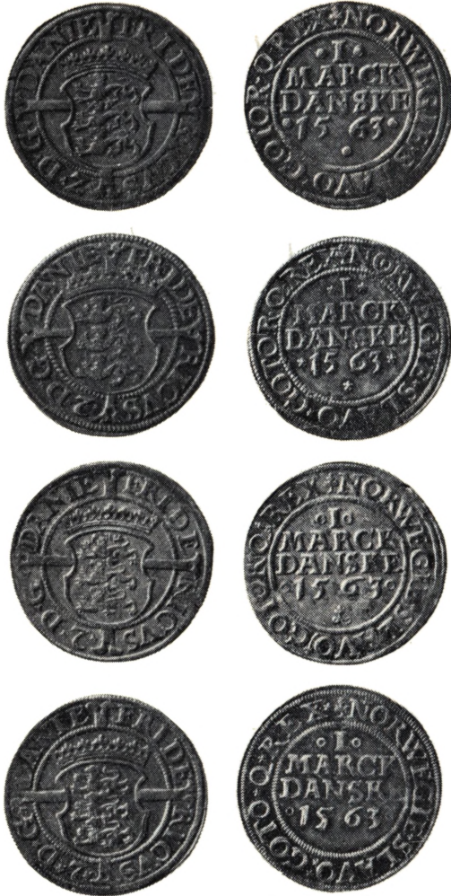
Forskellige Udmøntninger af ℞ . Rund Mønt af Aarstal 1563 med divergerende Mærker paa Reversen ved Aarstallet

Naar de forannævnte danske Dalere bar den ret usædvanlige Paa- skrift III MARCK DANSKE, var Bihensigten vel den at holde Menigmand for Øje, at en Daler var 3 ℞ . Formaalet naaedes jo ikke ved de Par Dalere, som udkom.